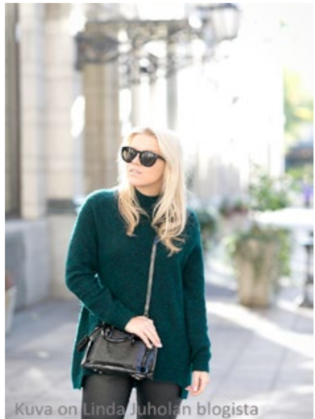
Kuva on Linda Juholan blogista

Blogi löytyy osoitteesta www.lindajuhola.com