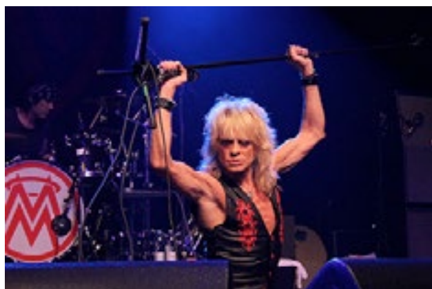
Kuka: Michael Monroe Milloin: 3.10.2014 Missä: Tanssisali Lutakko, Jyväskylä

Encore huipentui Malibu Beach Nightmreen, joka sai varmasti jokaisen paikalla olleen laulamaan, viimeistään Monroen niin käskiessä. "Come on, kyllä te tän osaatte!" Ja ihmiset osasivat. Michael osaa ottaa yleisönsä niin täydellisesti, ettei kukaan jää kylmäksi. Koko illan voisi kiteyttää hyvin eturivin nuorten hikisiin, leveästi hymyileviin kasvoihin ja ulko-ovella kuultuun huudahdukseen: "Michael Monroe ei petä koskaan!"